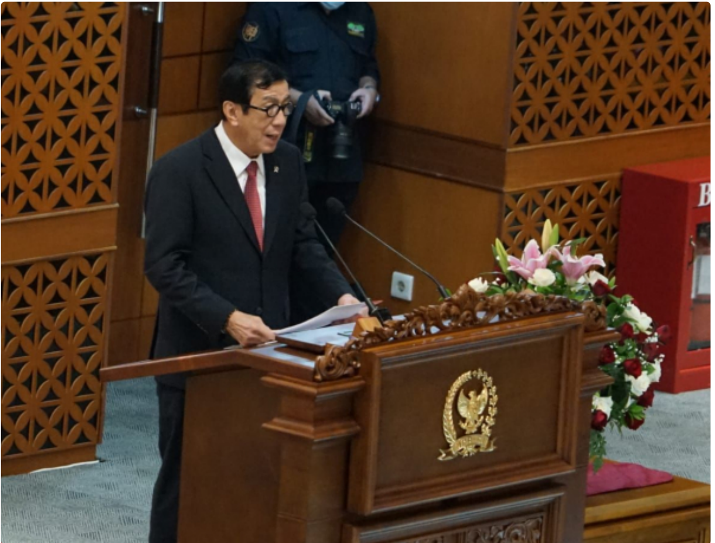
Menkumham Yasonna Laoly: UU Pemasyarakatan untuk Perkuat Keadilan Restoratif

JAKARTA – Menteri Hukum dan HAM Yasonna H. Laoly mengapresiasi semua pihak yang berperan dalam pengesahan Rancangan Undang-Undang tentang Pemasyarakatan menjadi Undang-Undang.